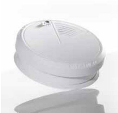
Geprüfte Rauchwarnmelder – eine kostengünstige Lebensversicherung.

Betätigen Sie gelegentlich den Prüfknopf und wechseln Sie rechtzeitig – etwa alle 2 Jahre – die Batterie; bei Batterieschwäche weist ein Warnton auf den notwendigen Batteriewechsel hin.