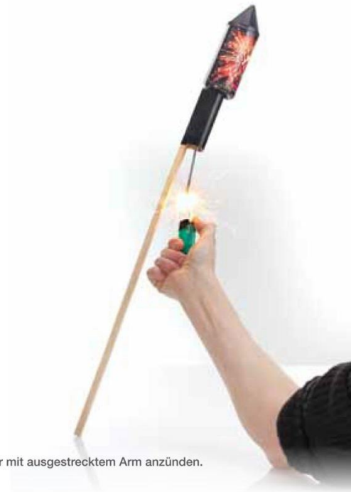
Raketen immer mit ausgestrecktem Arm anzünden.