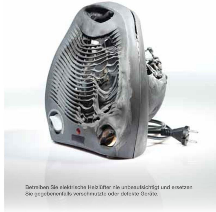
Betreiben Sie elektrische Heizlüfter nie unbeaufsichtigt und ersetzen Sie gegebenenfalls verschmutzte oder defekte Geräte.

Greifen Sie zum sicheren Anzünden des Kamins oder Ofens nur zu festen Anzündhilfen oder Sicherheitsbrennpasten. Verwenden Sie niemals flüssige Brandbeschleuniger wie Spiritus oder Benzin!